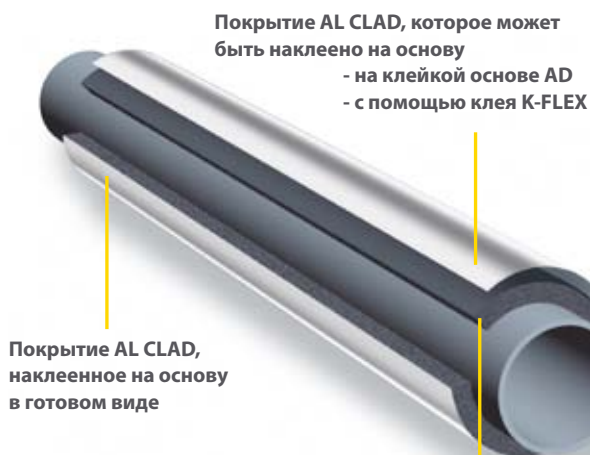
Теплоизоляция из вспененного каучука с закрытыми порами K-FLEX (ST / SOLAR HT / ECO)